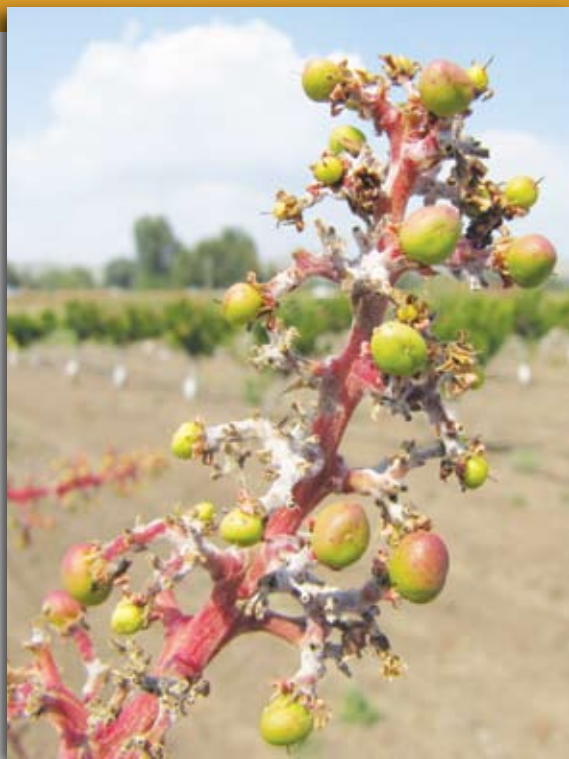
קימחון על תפרחת מגו

■ מחלת עיוות התפרחות: מחלה נוספת הפוגעת קשות במגו היא עיוות התפרחות ( Mango malformation ), הנגרמת מהפטריה Fusarium mangiferae . נמצא, כי קוטלי פטריות המכילים פרוכי' לורז ( Prochloraz ) יעילים כנגד הפטריה (7). ב-2014 נבדקה יעילות הריסוס של קוטל הפטריות מיראז' ( Prochloraz 450 ג/ליטר, 'מכתשים') בריכוז 0.1% (v/v) כנגד קימחון המגו במטרה למצוא פתרון משולב לשתי המחלות. המיראז' נבחן בהשוואה לריסוס קוטל הפטריות אופיר 2000 בריכוז 0.015% (v/v) ובהשוואה לעצי ביקורת