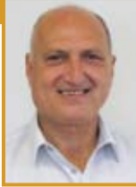
פרופ' משה ראובני